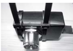
3. 固定バンドで、コネクタ部を固定する