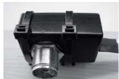
4. バンドをしっかり締め、余分を切断する