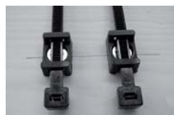
2. 固定バンドを台座に通す